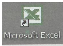
Sl. 1. Ikona programa Microsoft Excel

Najveći deo radnog prozora ( slika 2. ) zauzima deo dokumenta koji se vidi na ekranu ( radna tabela ). Na gornjem delu radnog prozora ( slika 2. ) nalazi se obično pet linija. Prva je, kao i kod svakog prozora, linija zaglavlja. U ovoj liniji nalaze se naziv dokumenta i naziv programa ( Microsoft Excel ). Kada se otpočne novi dokument, dok mu se ne dodeli naziv, Microsoft Excel mu dodeljuje radni naziv Book i redni broj ( Book 1 )