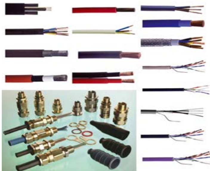
Слика 1. Изгледи неких врста каблова

Стандардни пресеци проводника дати су у таб.1